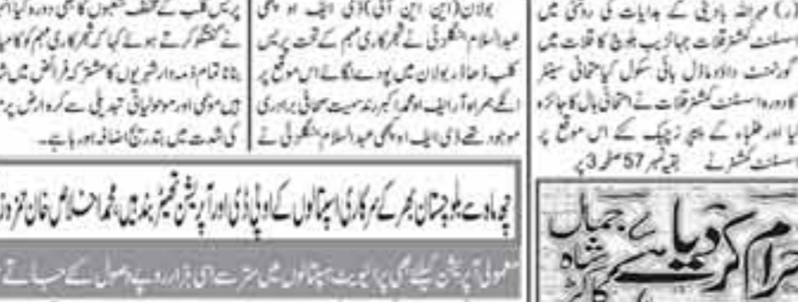
وزیر اعلیٰ نے استعفیٰ دینے سے انکار کیا، وزیر اعلیٰ نے استعفیٰ دینے سے انکار کیا۔