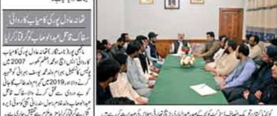
کوئٹہ اور دیگر تحصیلوں میں کھانے پینے کی سہولیات فراہم کی جائیں گی۔