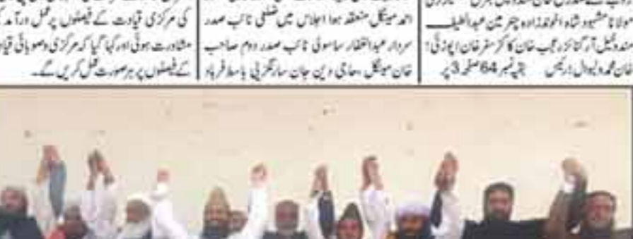
چھوٹے بلوچان کے لیے کابینہ میں فیملی جے کے انعقاد کیا گیا، یہ بات شہزاد اویلیم نے کہا۔