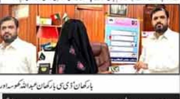
فرخیز کو بلوچستان (نارتھ) ایجنڈا نظر کے زیر اہتمام کابینہ میں فیملی جے کے انعقاد کیا گیا۔