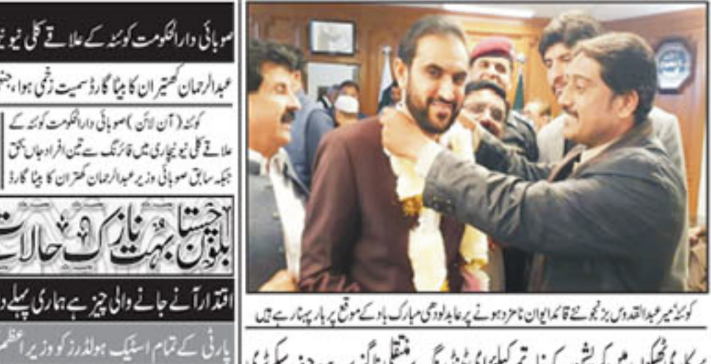
کوئٹہ میں صوبائی اسمبلی کے اجلاس کے دوران وزیر اعلیٰ بلوچستان کو شرفیاب کر کے سونپا گیا

سعودی عرب بھی ہمیشہ مشکل ترین وقت میں پاکستان کے ساتھ کھڑا رہا ہے، جس کو فراموش کیا جائے گا ہماری شرح نمودرت سمت جاری تھی بدقسمتی سے جیسے ملکوں کی تاریخ میں ہوتا ہے جانتا ہوں کرکٹ بیچ میں پاکستانی ٹیم کی جانب سے بچھاڑنے کے بعد بھارت کے ساتھ تعلقات بھڑکنے کے حوالے سے بات کرنے کا صحیح وقت نہیں، ہمارے درمیان صرف ایک مسئلہ کشمیر ہے ہم دو تہذیب یافتہ ممالک کے مابین اس مسئلے کو حل کر سکتے ہیں، اگر کشمیر یوں حقوق دیئے گئے تو ہمارے درمیان کوئی اور مسئلہ نہیں ہے، دوڑوں ممالک ایسے ہمسایوں کی طرح رہ سکتے ہیں، عمران خان کا خطاب