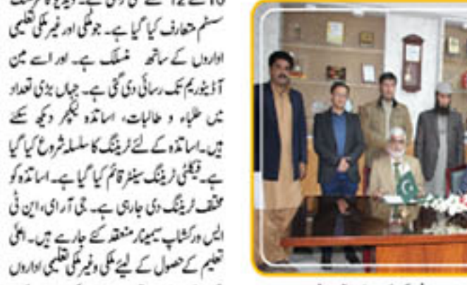
جامعہ بلوچستان کے سربراہان اور اعلیٰ تعلیمی سرگرمیوں کے فروغ کے لیے کام کر رہا ہے۔ ایگزیکٹو ڈائریکٹر اور اعلیٰ تعلیمی سرگرمیوں کے فروغ کے لیے کام کر رہا ہے۔

اساتذہ کی کثیر تعداد ہے۔ جو طلبہ و طالبات کو تعلیم کے ذریعہ ترقی دینے کے لیے کام کر رہا ہے۔ ایک بڑی تعداد میں اعلیٰ تعلیمی کے حصول کے لیے بیرون ملک میں بھیجی جاتی ہیں اور ان کے اخراجات کو اعلیٰ تعلیمی کے لیے فراہم کیا جاتا ہے۔