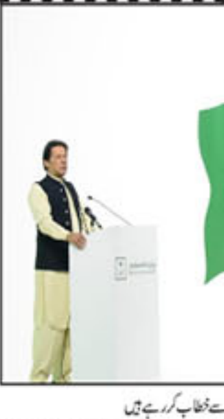
ریاض، وزیر اعظم عمران خان پاکستان سعودیہ سرمایہ کاری کی تقریب سے خطاب کر رہے ہیں

پاکستان سعودیہ کے مفاہمتی مذاکرات میں ترقیاتی معاہدے کی توقع ہے۔ پاکستان سعودیہ کے مفاہمتی مذاکرات میں ترقیاتی معاہدے کی توقع ہے۔