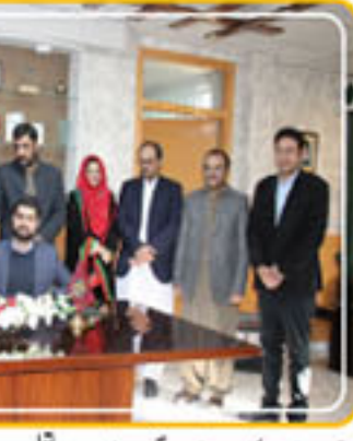
جامعہ بلوچستان کے سربراہان اور اعلیٰ تعلیمی سرگرمیوں کے فروغ کے لیے کام کر رہا ہے۔ ایگزیکٹو ڈائریکٹر اور اعلیٰ تعلیمی سرگرمیوں کے فروغ کے لیے کام کر رہا ہے۔

ہوئے ہیں۔ ایک وقت کے ساتھ تعلیمی اداروں کی ترقی ہوتے چاہیے ہیں اور ہر شعبہ کے ترقی یافتہ اور نئے نئے شعبوں کو مددگار بننے سے بلوچستان کے مستقبل کو روشن بنانے کے لیے کام کر رہا ہے۔