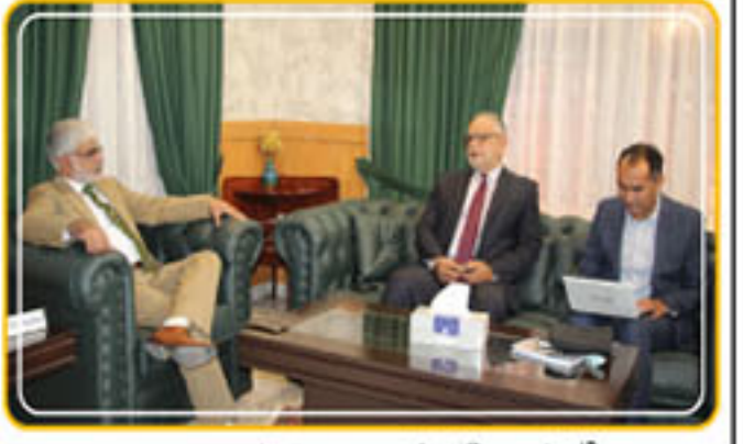
بلوچستان یونیورسٹی کے سربراہان اور اعلیٰ تعلیمی سرگرمیاں اور تعلیمی ادارے اپنے پاس سالانہ اور اس میں صوبہ اور ملک میں بہتر آسانیوں کی بنیاد پر اور سرپرستی، تحقیقی سرگرمیوں کے فروغ کے لیے کام کر رہا ہے۔ ایگزیکٹو ڈائریکٹر اور اعلیٰ تعلیمی سرگرمیوں کے فروغ کے لیے کام کر رہا ہے۔

بلوچستان یونیورسٹی جو صوبہ کا سب سے پرانا اور بڑا تعلیمی ادارہ ہے۔ 1970ء میں یون ہونے کے ناکارہ اور قائم ہو کر پاکستان کے بعد ملک کے چار یونیورسٹیوں میں شمار ہوتا ہے۔ جامعہ