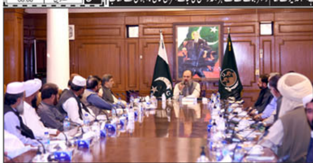
وزیر اعلیٰ بلوچستان جام کمال خان سے بلوچستان زمیندار ایجنسی کے وفد کا وفد ملاقات کر رہے ہیں۔